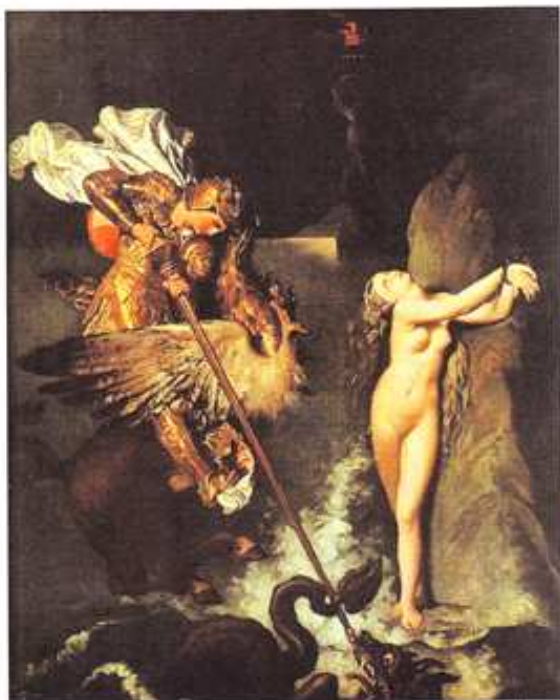
Ingres. Roger délivrant Angélique. 1830, peinture sur toile. National Gallery, Londres.

Isabelle Lévénéz : Le déclenchement s'est fait quand j'ai rencontré une femme qui m'avait confié qu'elle se faisait maltraiter par son mari. C'était une histoire de soumission ; elle en acceptait le "jeu" parce que c'était comme ça qu'il l'aimait et elle en était elle-même très amoureuse. Comme cela ne me renvoyait pas à moi, je n'ai pas imaginé une minute lui demander de jouer la situation et, en même temps, je me suis dit qu'en utilisant mon corps, je pouvais peut-être parler de ça. C'est ainsi qu'est née la pièce intitulée Soumission . C'était la première fois que je me mettais devant la caméra.