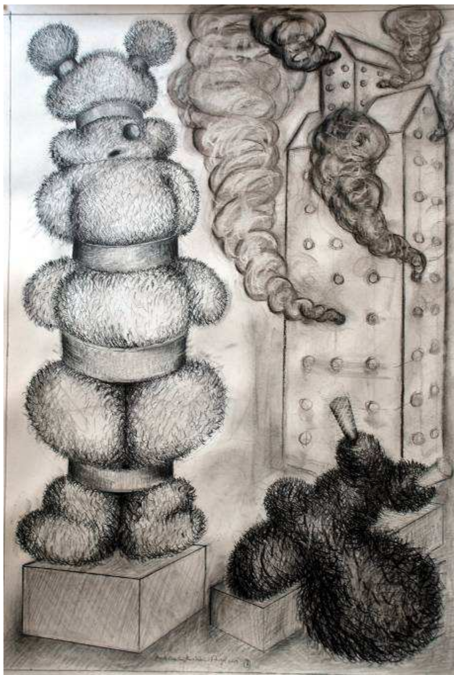
Dessin, 2009, fusain, mine de plomb, craie grasse, 100 x 70 cm