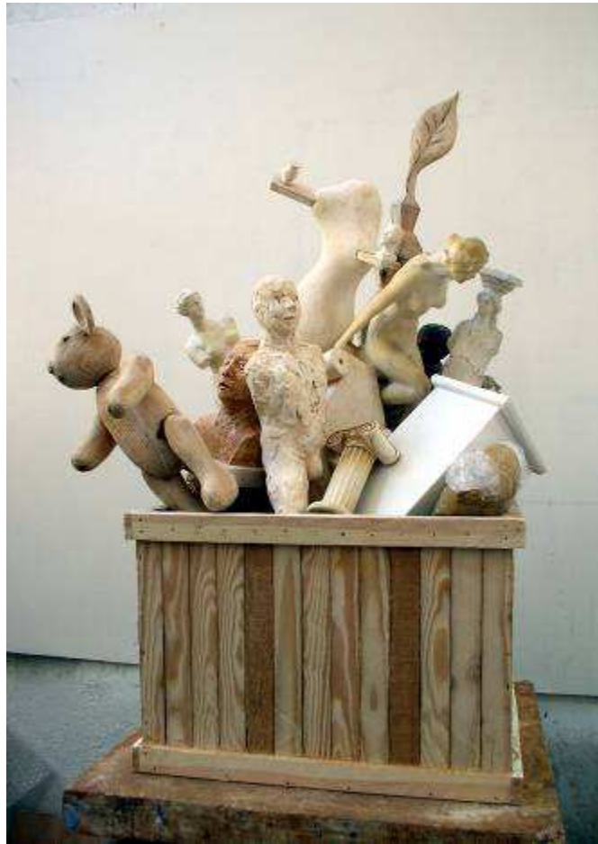
Maquette-projet sculpture, exposition Musée des Beaux-Arts de Nantes, 2009