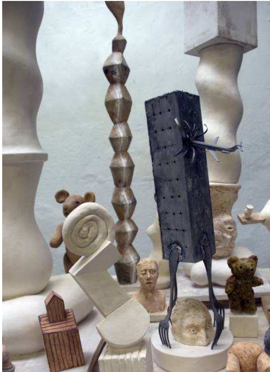
Vue installation, Marseille atelier, 2009.