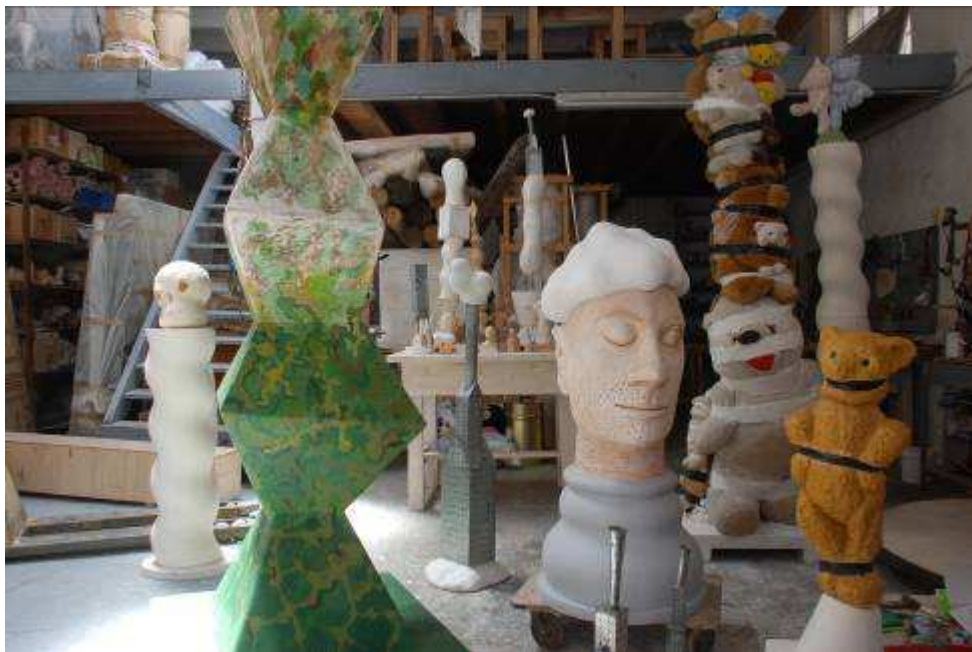
Dominique ANGEL, atelier Marseille, 2009