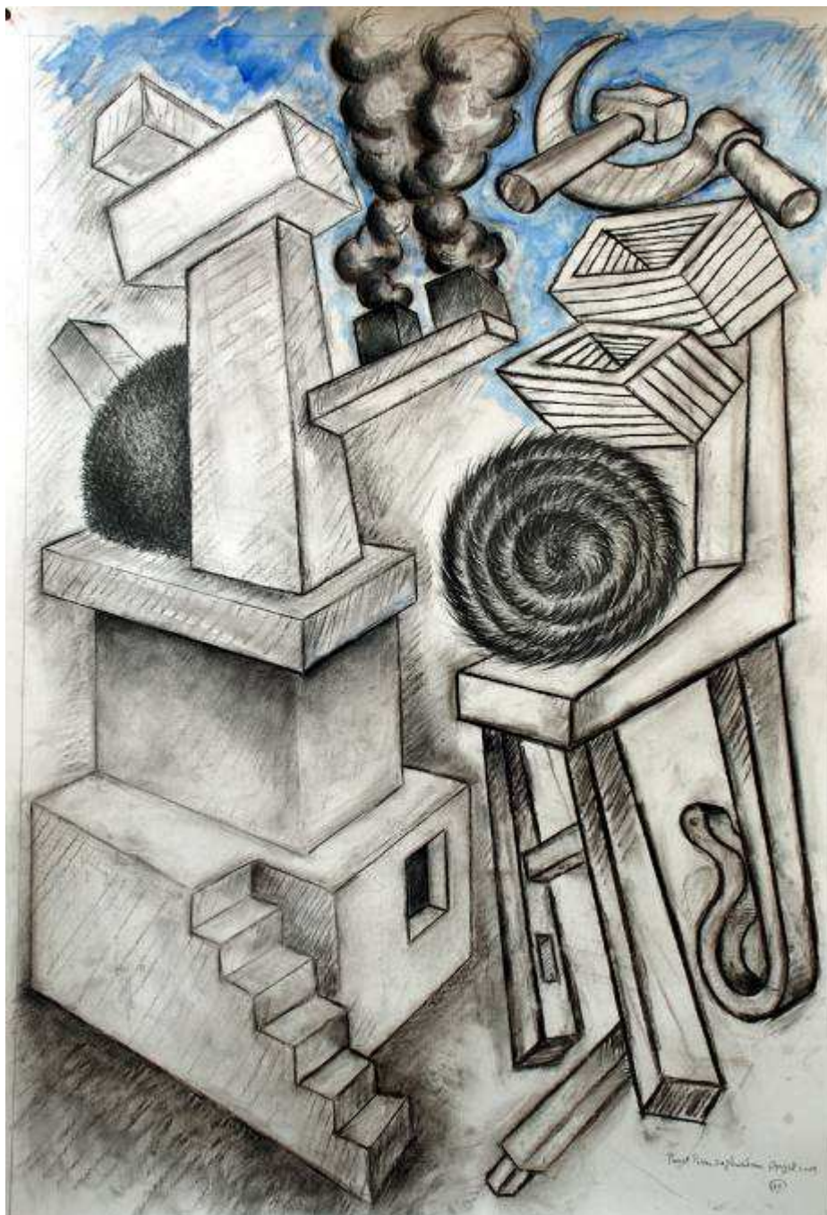
Dessin, 2009, fusain, crayon, aquarelle, mine de plomb, 100 x 70 cm