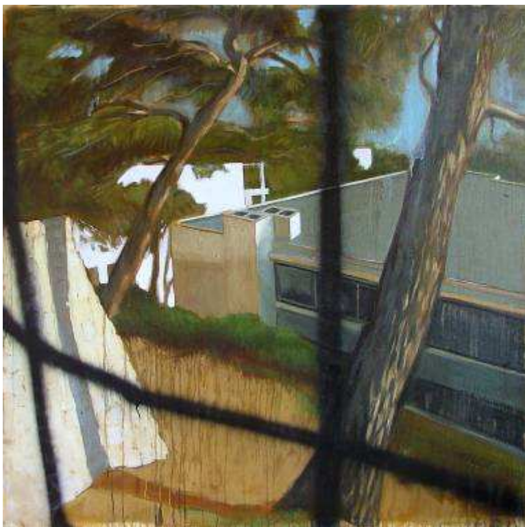
Paysage n°45 Huile sur toile, 122 cm x 122 cm, cadre chêne et verre organique, 2007