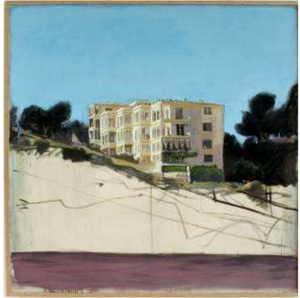
Paysage n° 35

A mieux y regarder en effet, Liron ne peint pas des immeubles, des tours ou des villas : il peint des constructions dans les champs, des villas entre des arbres et des rochers, une usine dans un pré. Il peint leur intrusion. Il peint l'irruption de leurs volumes anguleux et de leurs murs droits dans ce qui était, auparavant, il y a plus ou moins longtemps, un bois ou une vallée. Des barrières et des grillages découpent l'espace et quelques indices permettent d'imaginer encore à demi ce qui était là, autrefois, avant ces découpages, avant ces séparations. Des plans de béton blanchi ou de brique rouge tombent comme des lames. Des lignes sombres coupent à travers de la toile. Les terrasses écornent le ciel. Les fondations scient la terre. Il y a quelque chose d'inguérissable et d'impardonnable dans ces vues d'aujourd'hui, quelque chose qui fait confondre ces constructions avec des tombeaux et qui rappelle d'anciens souvenirs de peinture, ces paysages du XVII e siècle bâtis de terrasses, d'escaliers et de pyramides incongrus parmi les rocs et les sources des montagnes. A cette différence près que ceux-ci opposaient le chaos de la nature à l'harmonieuse géométrie humaine alors que, désormais, la monstrueuse géométrie humaine insulte ce qui pourrait rester de désordre quelque part.