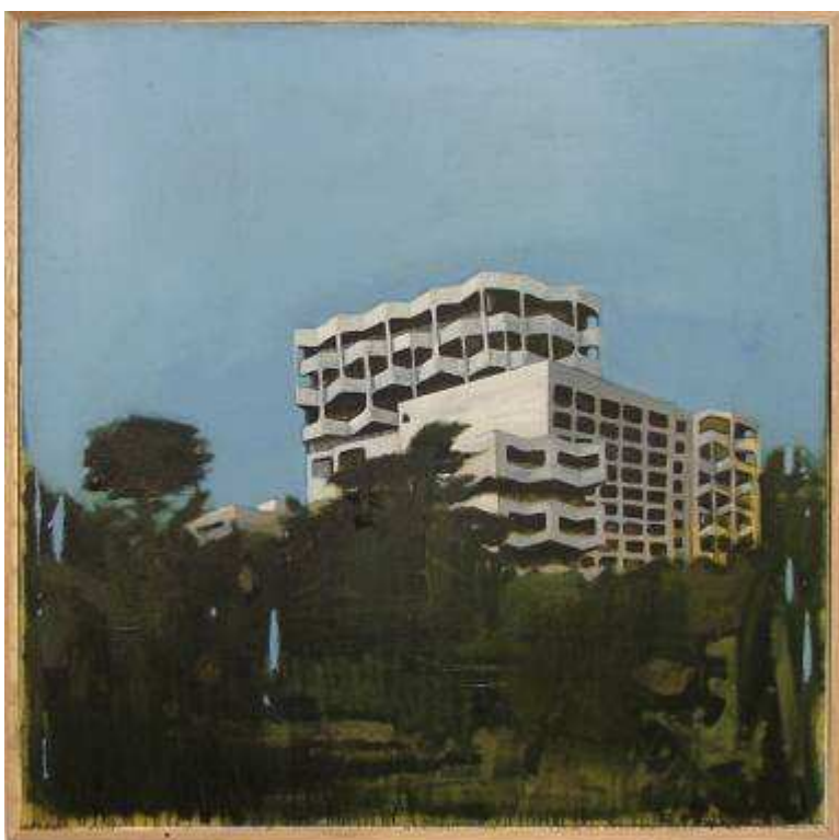
Paysage n°56 Huile sur toile, 122 cm x 122 cm, cadre chêne et verre organique, 2007